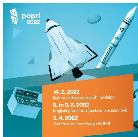
slika: POPRI 2022 Banner FB IG