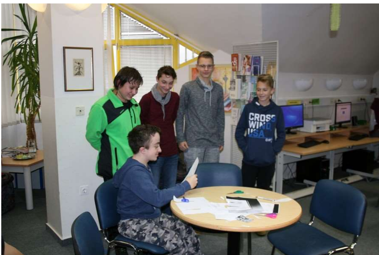
Jaka poroča, takrat še ne vemo, da je to zmagovalna skupina