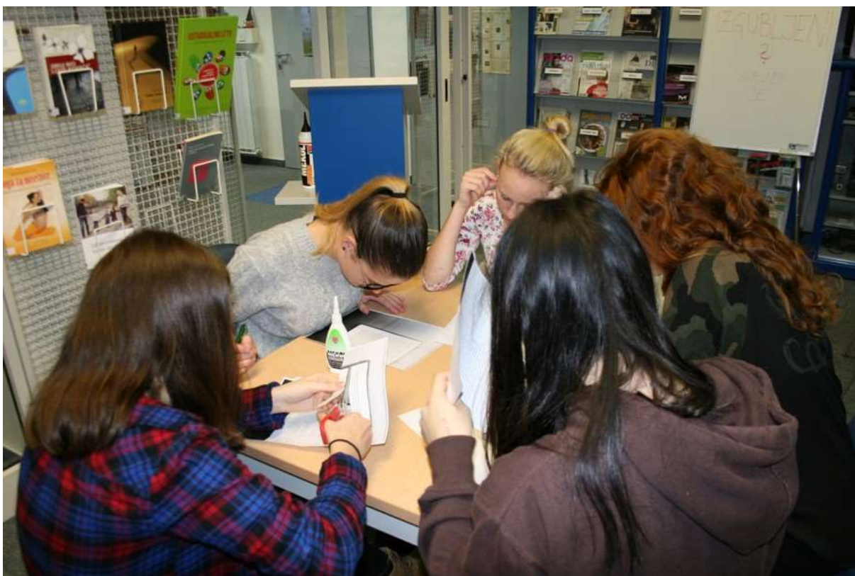
Potrebno je bilo natančno prebrati konkretna navodila