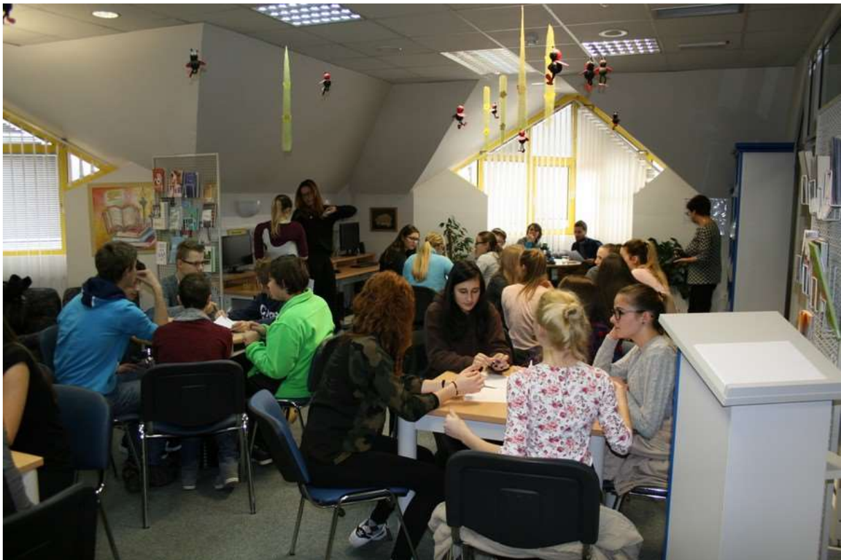
Dijakinji Gimnazije Ravne na Koroškem dajeta navodilo za skupinsko delo

Že drugo leto poteka projekt splošnih knjižnic »Mladi, povabljeni v koroške knjižnice« z delovnim naslovom KNJIŽNE MIŠICE. Pri projektu sodelujejo zlati bralci koroških osnovnih šol, to so učenci, ki berejo za Bralno značko vseh devet let. Prvega srečanja v tem šolskem letu se je v sredo, 23. 11. 2016, v Knjižnici Dravograd udeležilo 21 zlatih bralcev OŠ Neznanih talcev Dravograd z zlatimi bralci OŠ Šentjanž. Srečanje, ki so ga vodili dijaki Gimnazije Ravne na Koroškem, je bilo posvečeno iskanju izgubljenih knjig v dobesednem in prenesenem pomenu. Učenci so se morali znajti v splošni knjižnici v iskanju knjig, ustrezno povezati odlomke iz različnih knjig in svoje delo tudi predstaviti v obliki govornega nastopa. Komisija je pregledala delo tekmovalnih skupin in razglasila najbolj uspešne tekmovalce, ki jih je tudi nagradila.