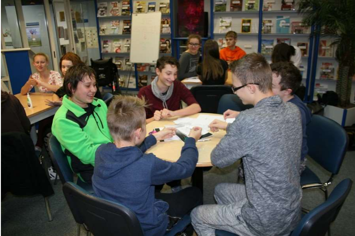
Vsi se dobro zabavamo