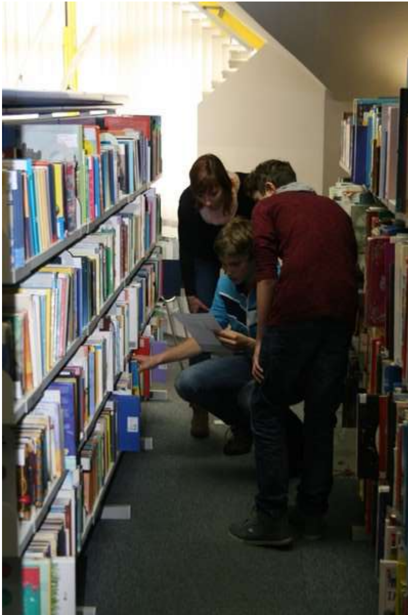
Pomoč knjižničarke je bila zelo dobrodošla