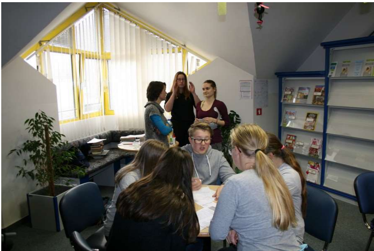
Tudi članice komisije debatirajo