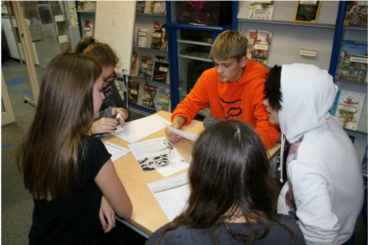
Vsak v skupini nekaj počne