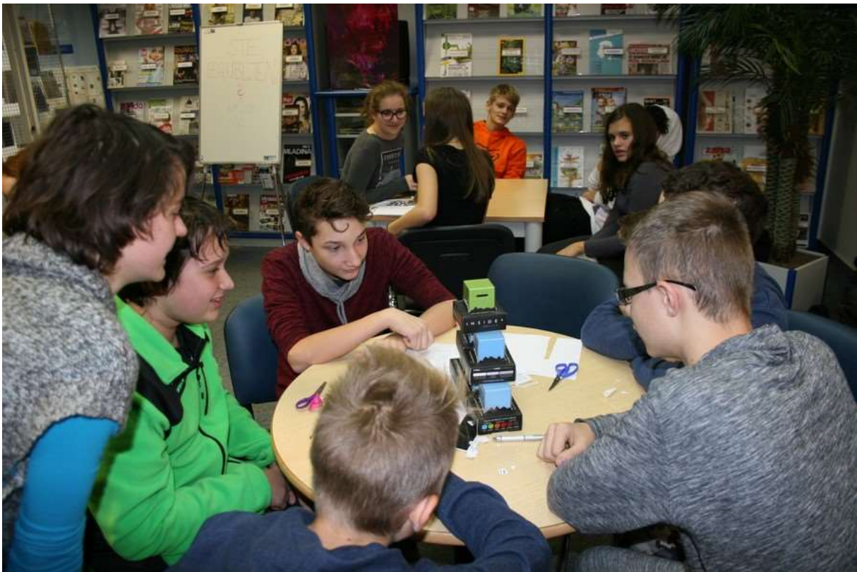
Nagrada je zelo zanimiva