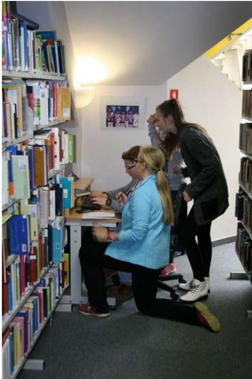
Napeto iskanje informacij po Cobiss-u